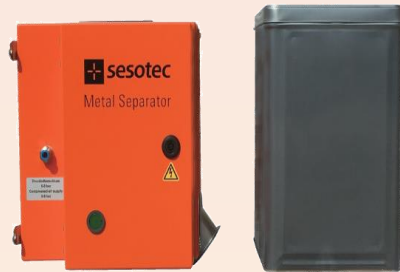
一斗缶と同じサイズ