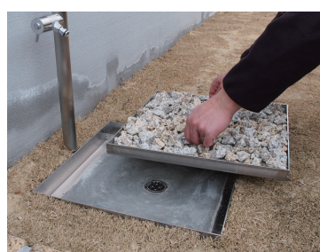
砂利を充填したまま開閉できます