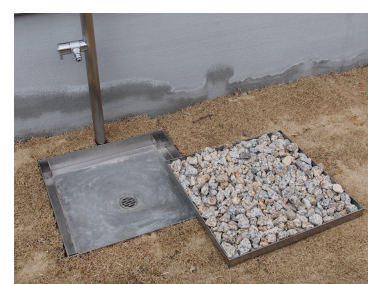
水受けを取外してメンテナンスができます