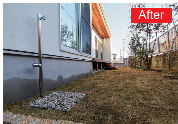
GLとフラットな納まりのため立水栓の近くまで歩行が可能で庭が広く感じます。お好みの砂利を敷き詰めて外構デザインのアクセントに。