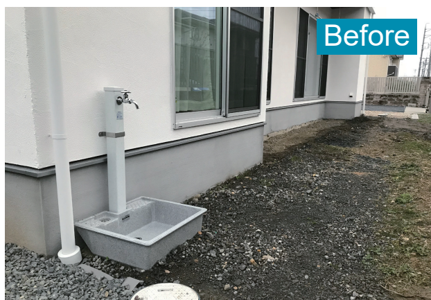
標準的な水栓パンは水受けの立ち上がりがあるため庭が狭く感じます。